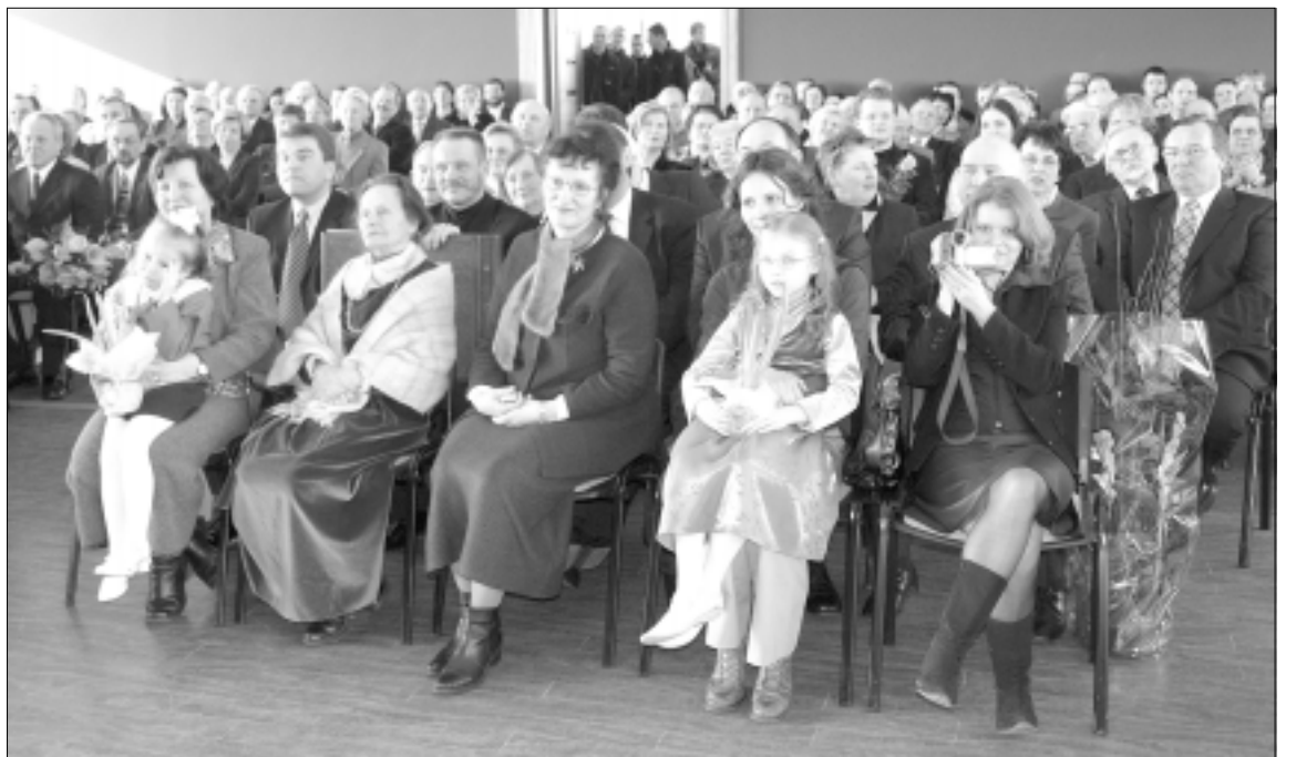
Tarp iškilnių dalyvių buvo rektorius Romualdo Deltuvo mama ir dvi seserys