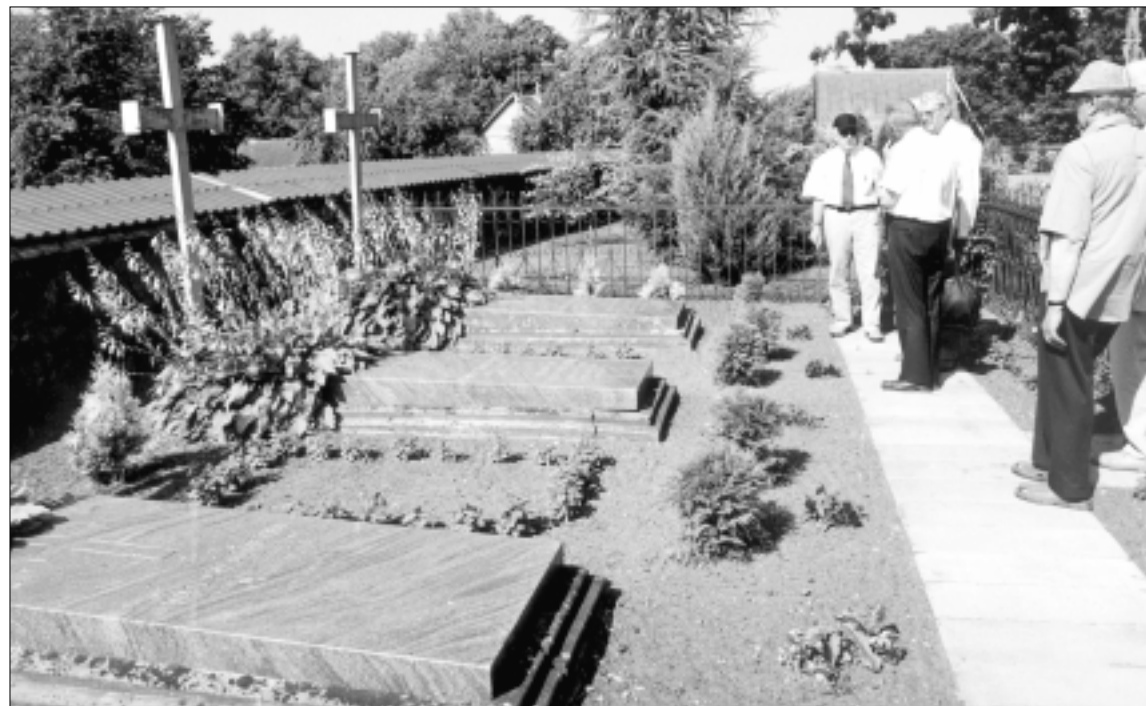
Paskutinioji Gervėčių Domeikų poilsio vieta bažnyčios šventoriuje