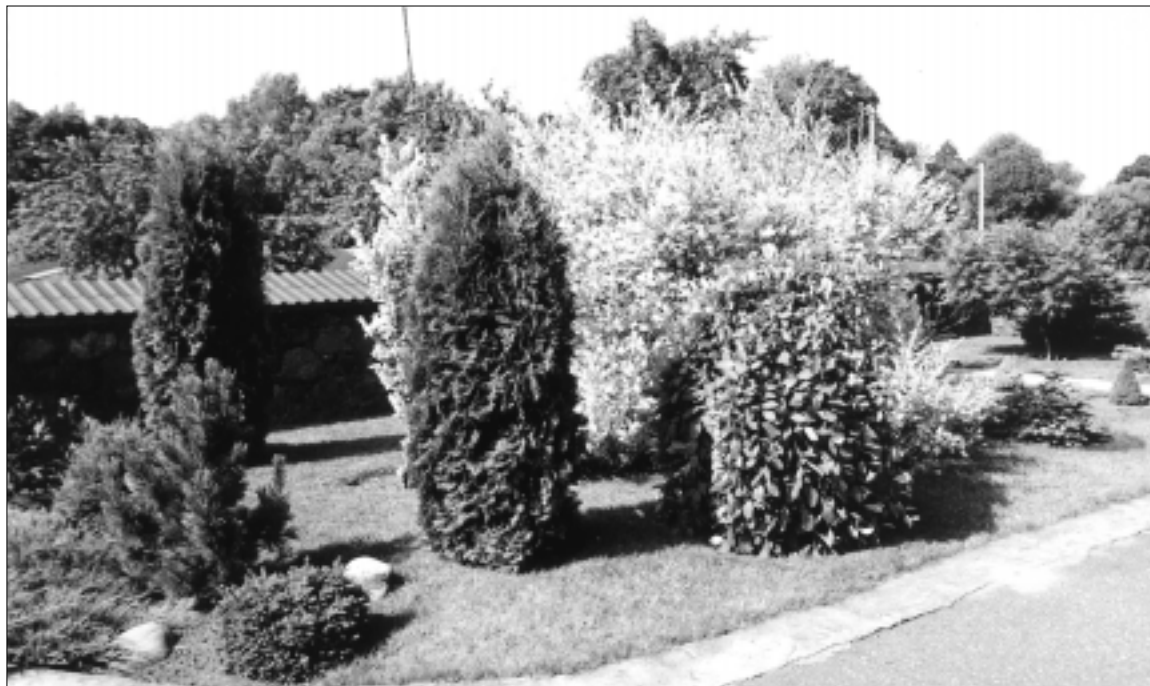
Nuostabų botanikos sodą primena Gervėčių bažnyčios šventorius