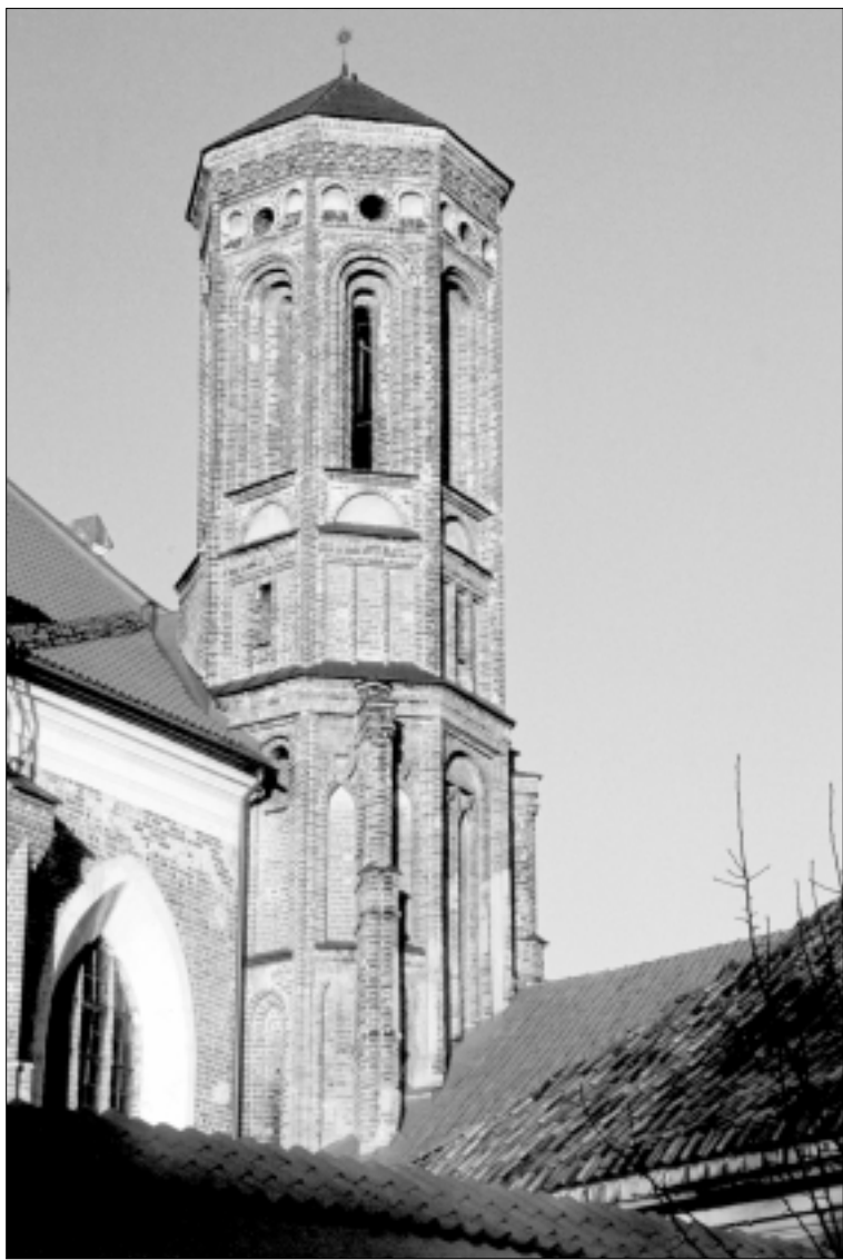
Vilniaus Bernardinų bažnyčios bokštelis – įspūdingas vėlyvosios gotikos pavyzdys