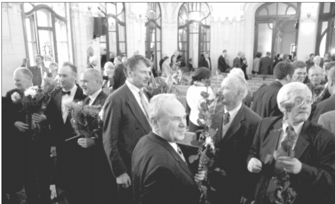
Pirmieji įspūdžiai po mokslo premijų įteikimo