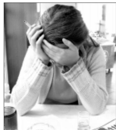
Nemigos kamuojamas žmogus tampa nedarbingu, lengviau pasiduoda žalingiems įpročiams