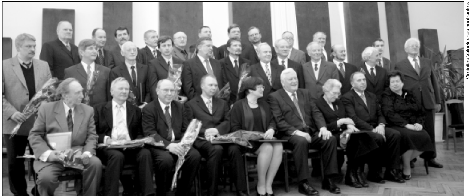
2004 m. Lietuvos mokslo premijos laureatai su Lietuvos Respublikos Ministru Pirmininku Algirdu Mykolu Brazausku ir Lietuvos mokslo premijų komiteto nariais