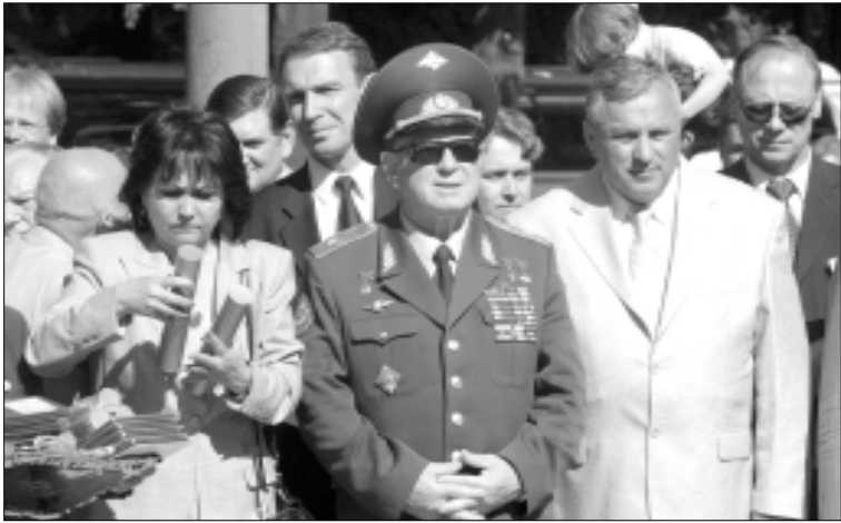
Kosmonautui Aleksejui Leonovui Liudviko Rėzos paminklas padarė didelį įspūdį