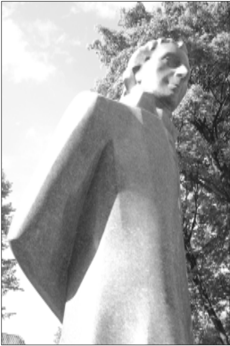
Paminklo Liudvikui Rėzai fragmentas