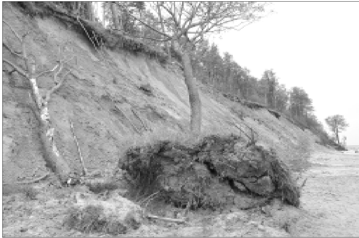
Baltijos kranto likimas ties Karkle nenuspėjamas

akmenis, dabar juos vežė atgal ir vertė į jūrą. Ir kodėl to entuziazmo nerodyti, jei valstybė iš savo kišenės už tą darbą suplojo dar 1,5 mln. litų. Taip buvo pastatyta buna, kainavusi bene brangiausiai Europoje – paminklas nekompetencijai ir neišmanymui.