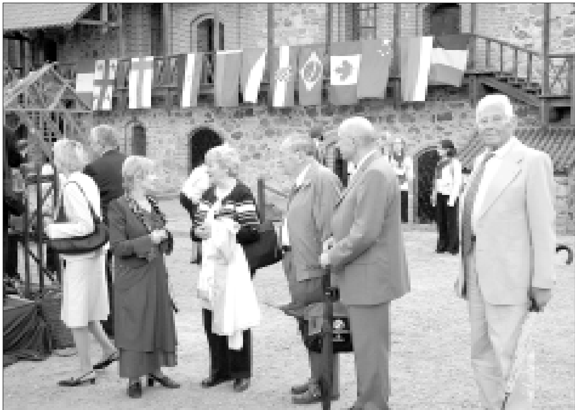
Kongreso atidarymo vakaro akimirka Trakų salos pilyje

Aišku, tai buvo paprasta empirika, tačiau ji privertė elektrofiziologus susimąstyti, kodėl taip atsitinka. Išsiaiškinti daugelio širdies aritmijų mechanizmai. Tyrimai atvedė prie dabartinio tų problemų supratimo. Taigi mūsų darbas padėjo širdies elektrofiziologams atskleisti daug naujų dalykų. Visa tai išgirsti Mask-