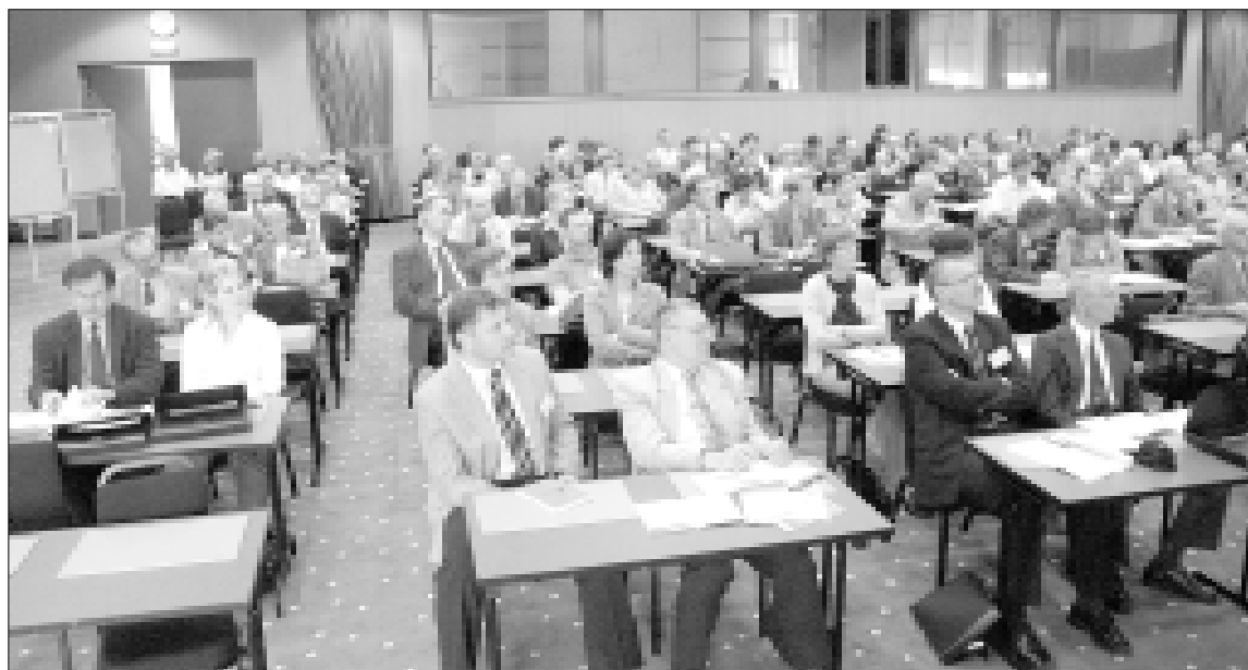
Grothuso elektrochemijos konferencijos dalyviai „Reval Hotel“ viešbučio konferencijų salėje