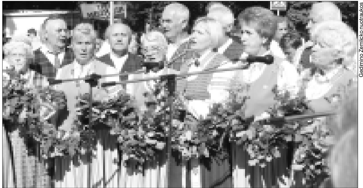
Liudviko Rėzos draugijos Karaliaučiuje nariai, atidengiant L. Rėzos paminklą, gieda „Lietuva brangi“

kultūra patenka į „daugelio kitų tautų kultūrų“ kategoriją. Beje, nei senieji prūsai, nei lietuvininkai nebuvo net paminėti.