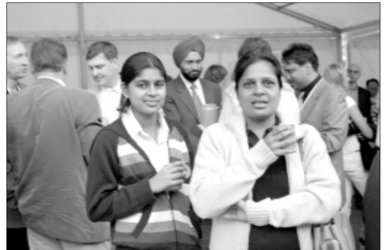
Kongrese dalyvavo ir tolimiausių šalių atstovai

gresą yra atvykusių mokslininkų, kurie jau naudoja kamienuose ląste- lių technologijas. Pavyzdžiui, jei šir- dies raumuo pažeistas, o po infark- to reikia atkurti kraujotaką, tai į šir- dies raumenį įšvirkščiamas kamienu- nių ląstelių, o šios naujoje vietoje virsta šeimininko, t. y. širdies rau- mens, ląstelėmis. Esama įrodymų, tiesa, jų dar nėra daug, kad šitaip yra pavykę atkurti ląsteles, kurios gali susitraukinėti, atlikti būdingas funkcijas.