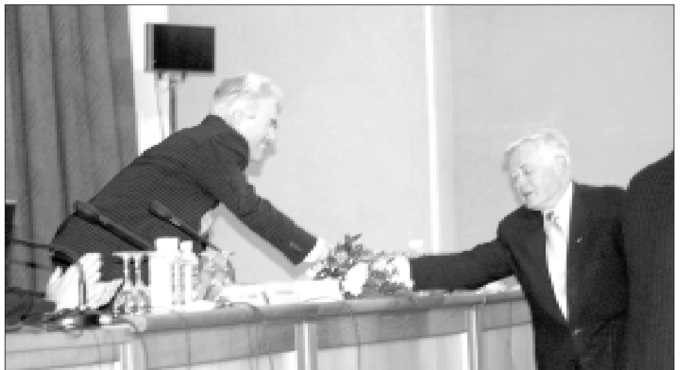
Simpoziumo programos tarybos pirmininkui akad. Zenonui Rokui Rudzikui Simpoziumo darbe sėkmės linki Lietuvos Respublikos Prezidentas Valdas Adamkus