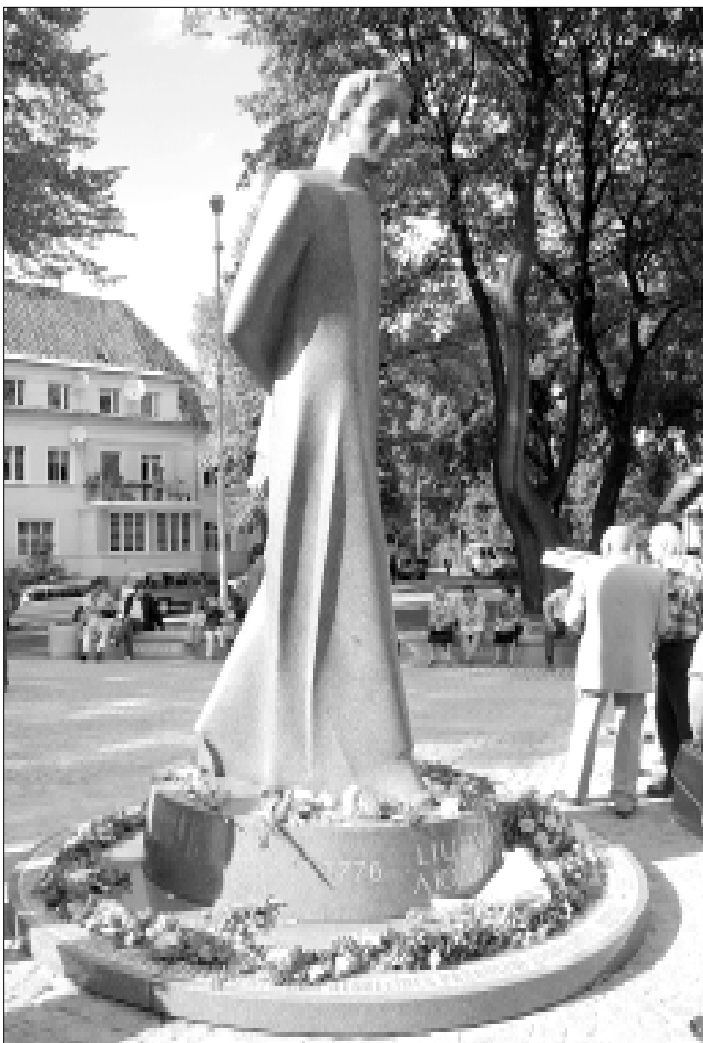
Lietuvos skverą Karaliaučiuje papuošė Liudviko Rėzos paminklas