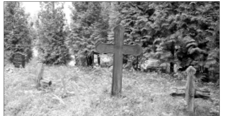
Karklininkų kapinėse daug senųjų lietuvininkų kapų

1956 m. dar 42 šeimos iš Karklininkų buvo iškeldintos, nes reikėjo parengti vietą pasienio kariniam daliniui. Buvo nugriauta visa šiaurinė kaimo dalis – reikėjo vietos kariniam poligonui. Nugriauta ir Karklininkų bažnyčia. Ji buvo baigta statyti ir pašventinta 1910 m., pamaldos laikytos lietuvių ir vokiečių kalbomis. Bažnyčia tik šiek tiek buvo apgadinta per karą, bet sovietų kariuomenės poligonui tapo kliuviniu, todėl nugriauta, išliko tik bažnyčios pamatų žymės.