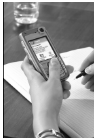
Mobilusis telefonas kenkia ar padeda? Mokslininkai kol kas negali tiksliai atsakyti į šį klausimą