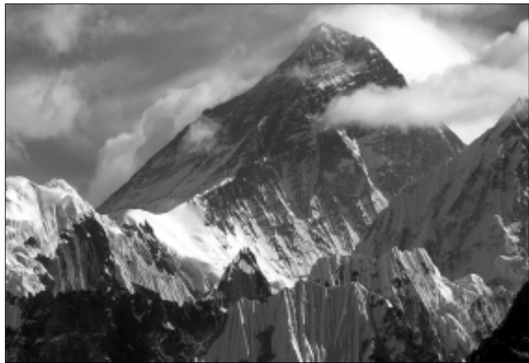
Everestas traukia ne tik alpinistus, bet ir medikus