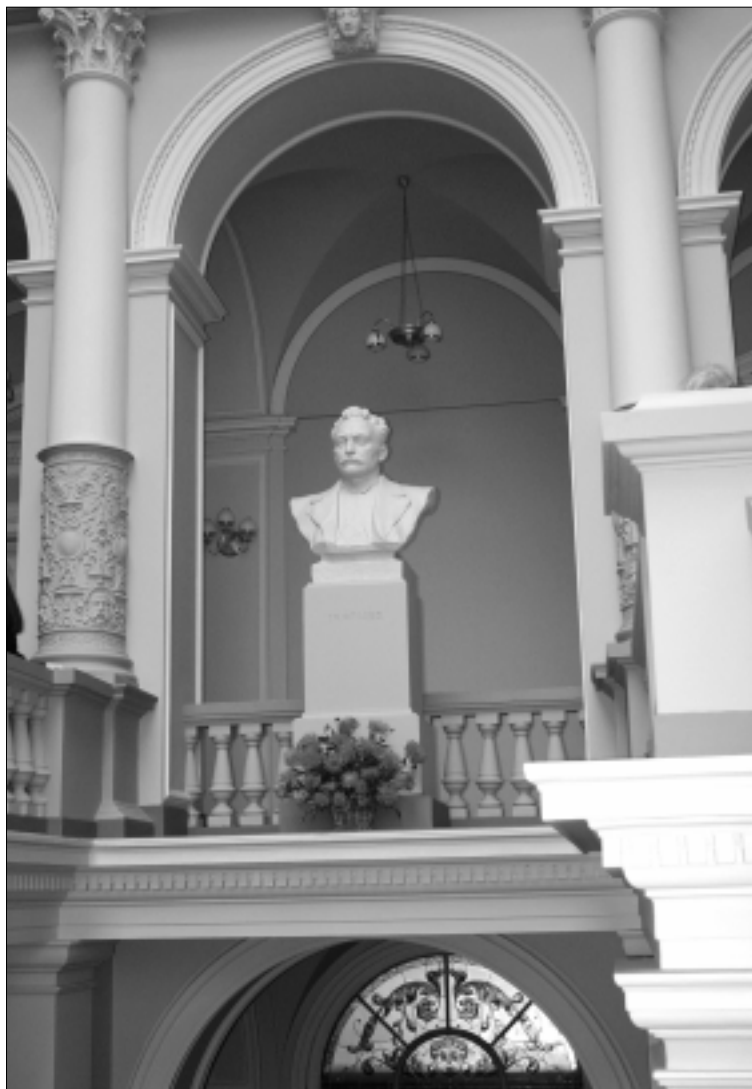
Lvovo nacionalinio Ivano Franko universiteto vestibulyje – Ivano Franko skulptūrinis biustas