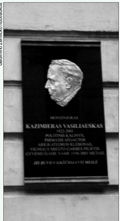
Paminklinė atminimo lenta monsinjorui