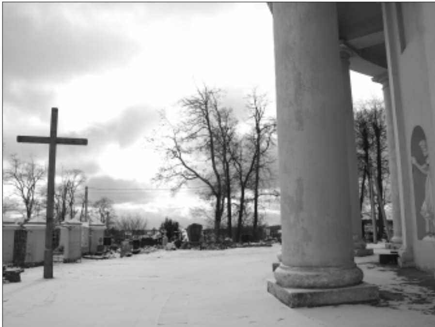
Sudervės bažnyčios šventoriuje