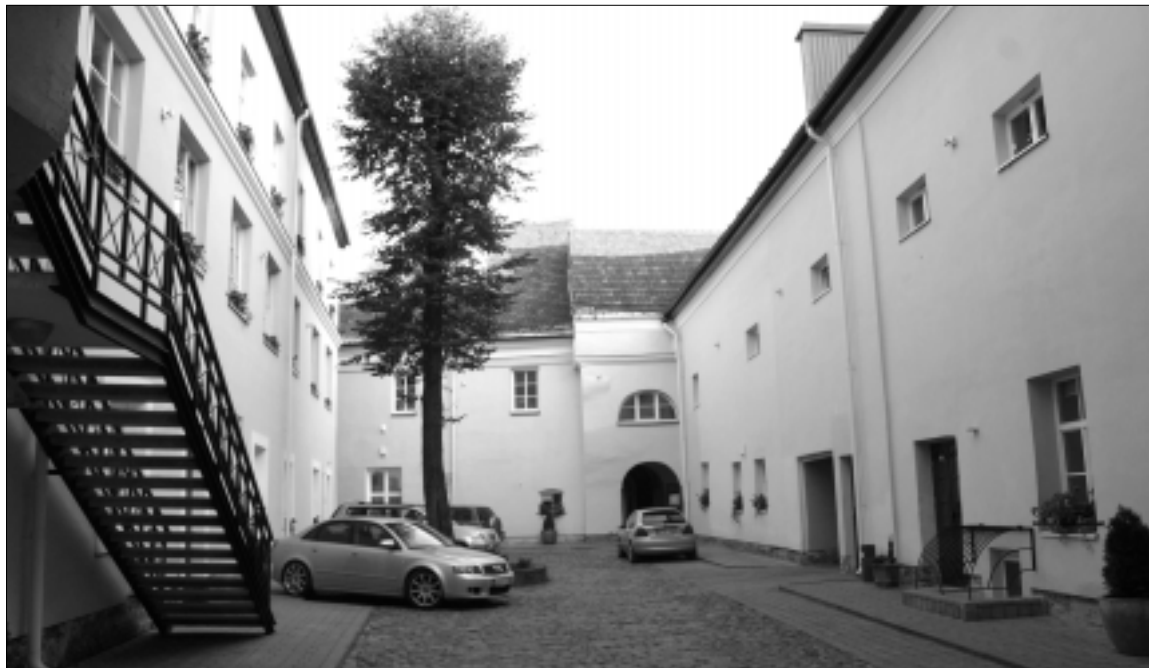
Taip atjaunėjęs buvęs benediktinių vienuolyno kiemas

Šitą T. Venclova jau žinojo – B. Pasternakas, o skirta Paolo Jašvili, За прошлого порог... , 1936 metai. Tai