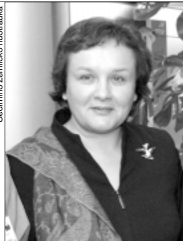
Europos Parlamento narė dr. Laima Andrikiene

Daugiausia lėšų – 5,930 mlrd. eurų – teks Erasmus programai, siekiant, kad iki 2011 m. Erasmus studentų skaičius būtų 3 mln. (šiuo me-