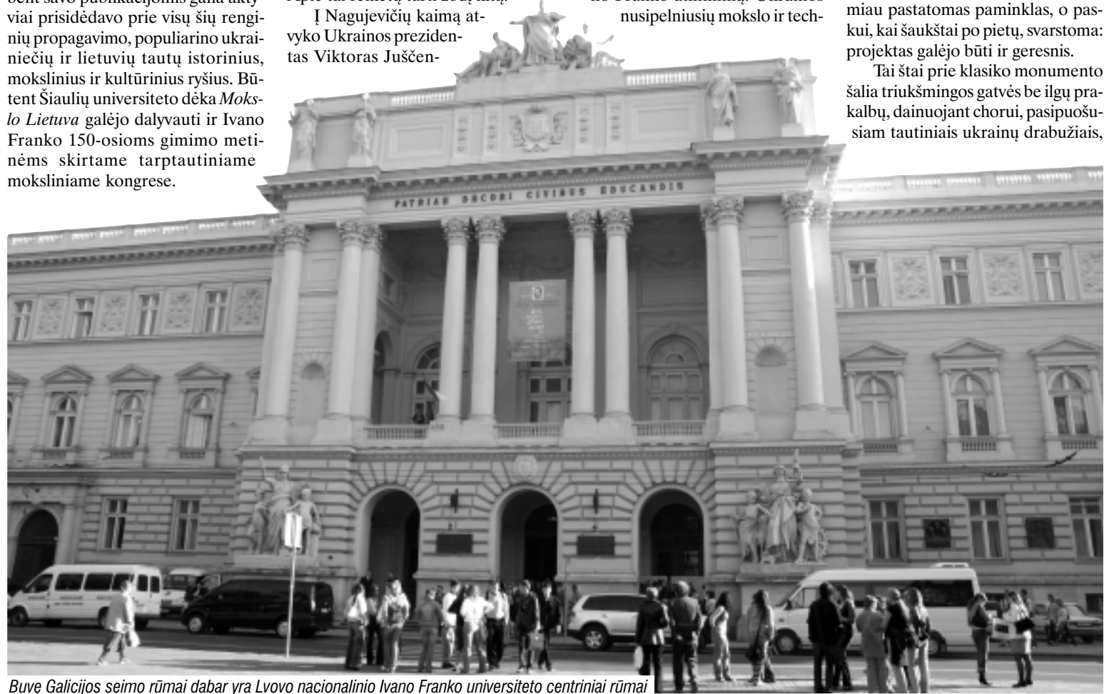
Buvę Galicijos seimo rūmai dabar yra Lvovo nacionalinio Ivano Franko universiteto centriniai rūmai

Tai štai prie klasiko monumento šalia triukšmingos gatvės be ilgų prakalbų, dainuojant chorui, pasipuošusiam tautiniais ukrainų drabužiais,