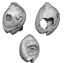
Archeologų rastos moliuskų kriauklės su skylutėmis