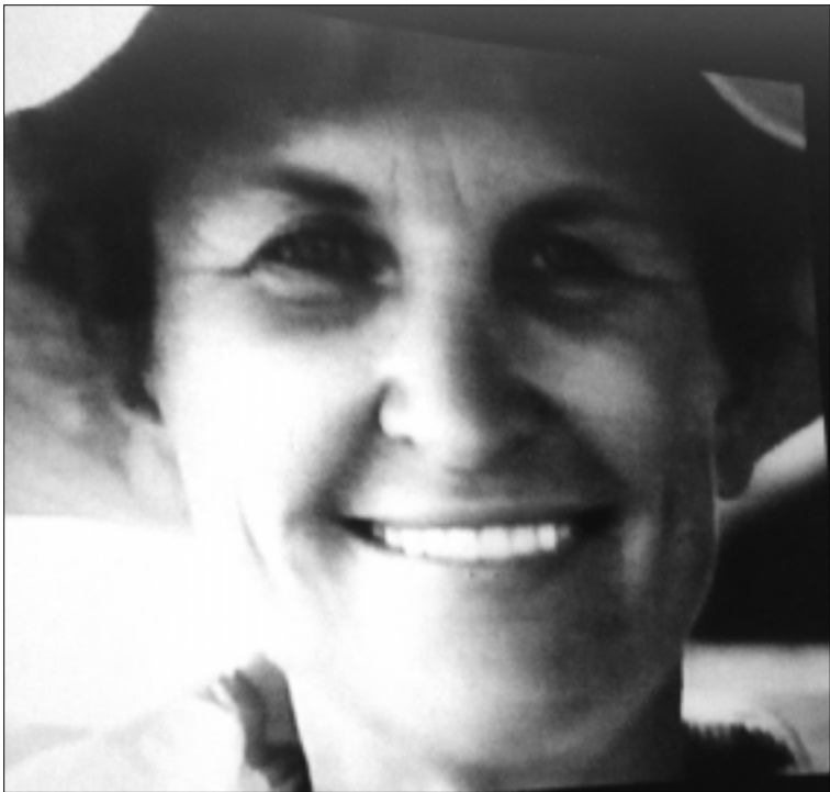
Marija Gimbutienė – kadras iš kanadiečių filmo „Ženkla už laiko ribų“ Pradžia Nr. 3