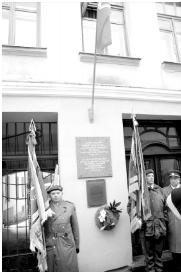
Garbės sargyba prie atminimo lentos