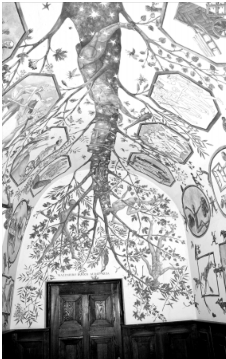
Dailininko Petro Repšio Gyvybės medis Vilniaus universiteto Filologijos fakultete – archeomitologijos vaizdinys