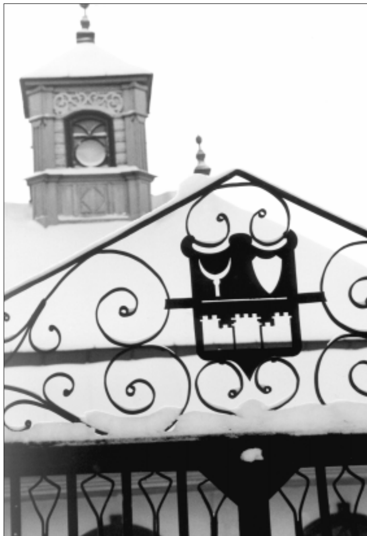
Orientalistikos motyvas Trakuose: karaimų maldos namai